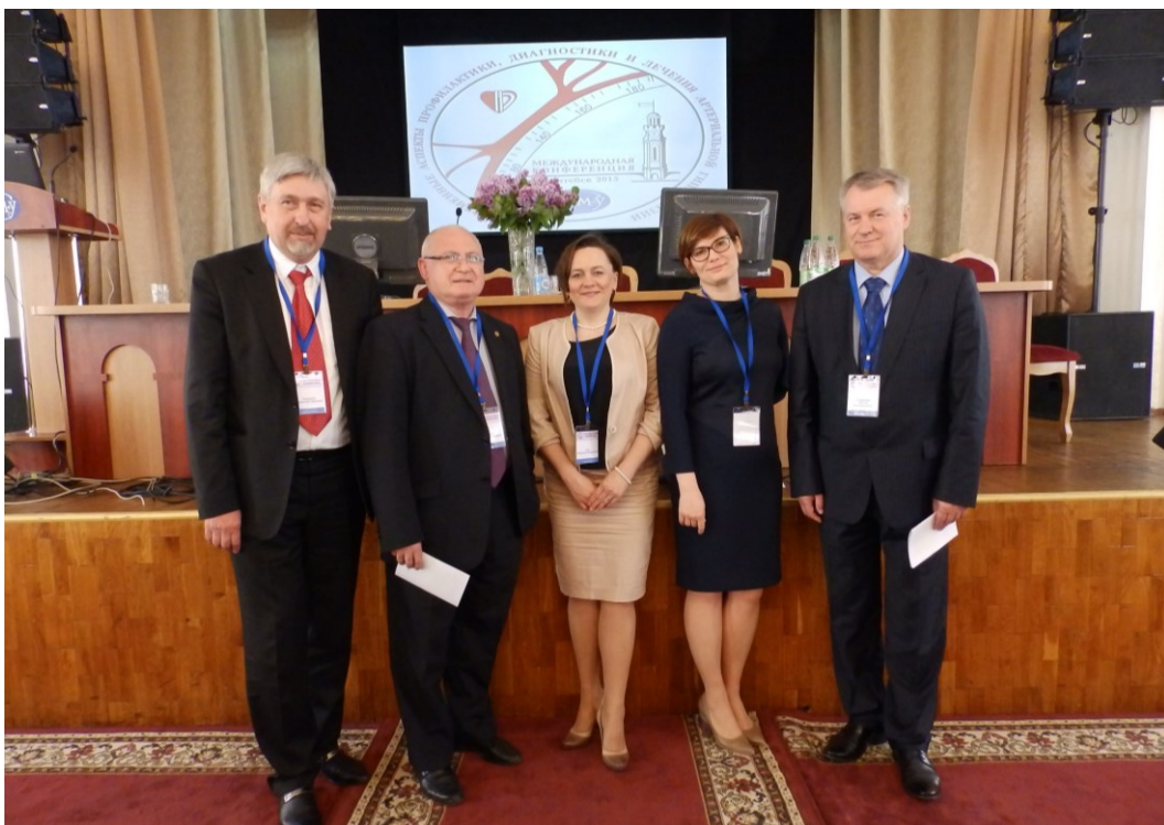
На конференцыі ў Віцебскім дзяржаўным медыцынскім універсітэце (2015)