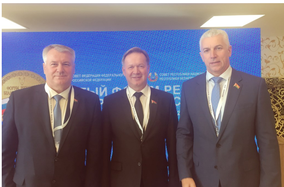
Участие в 5-м Форуме регионов Республики Беларусь и РФ (Могилев, 2018)