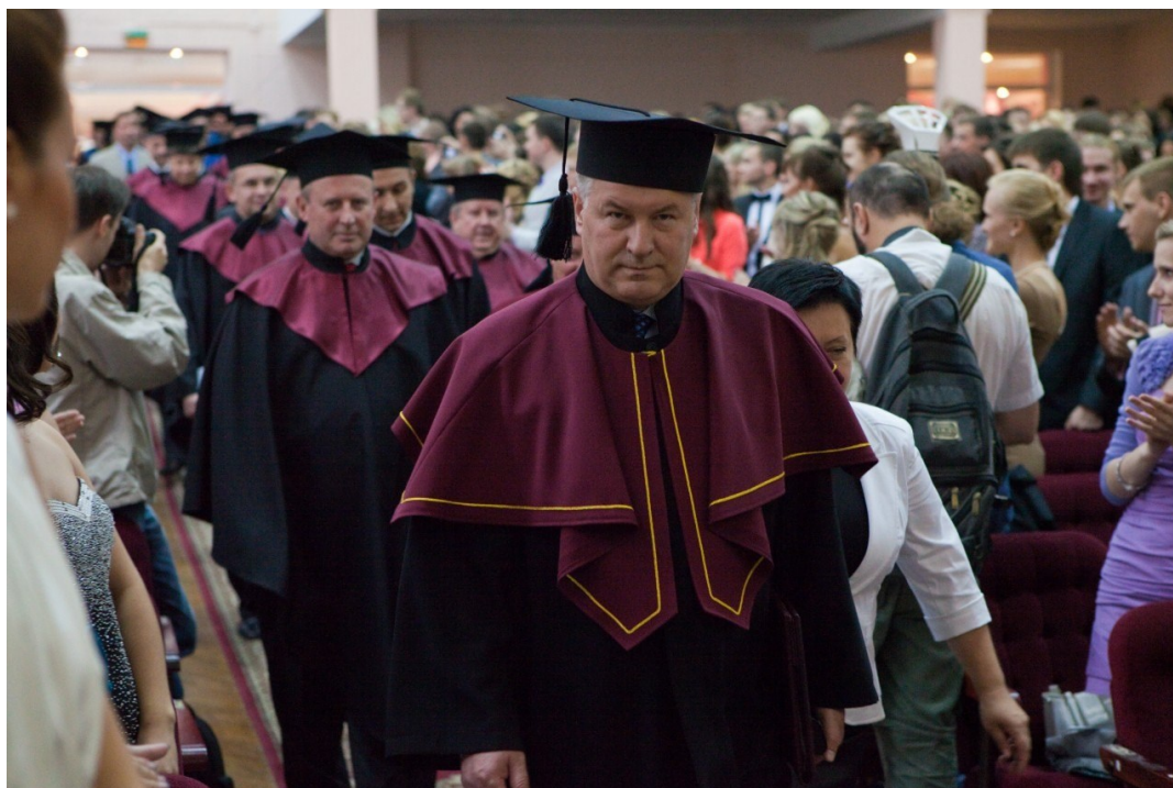
На вручении дипломов выпускникам (2012 г.)