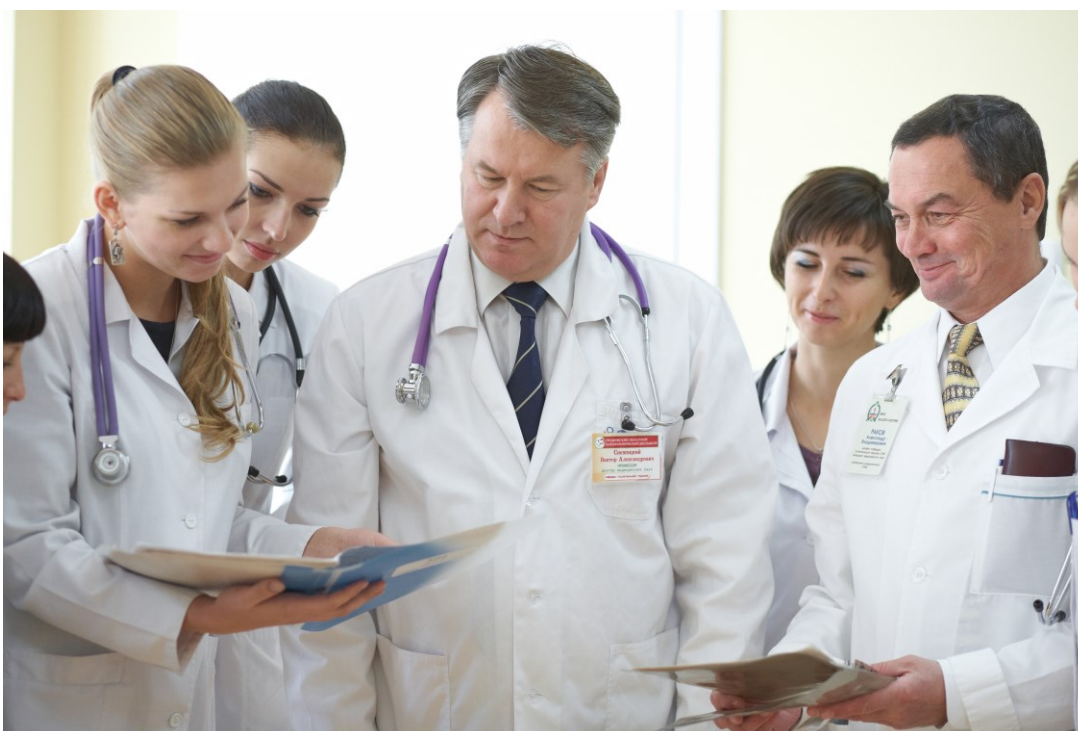
Обсуждение пациента (Гродненский областной клинический кардиологический центр, 2014)