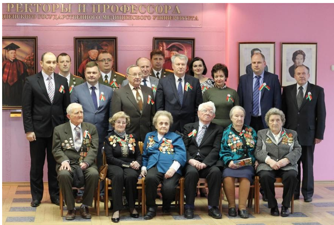
Встреча с ветеранами Великой отечественной войны (2016)