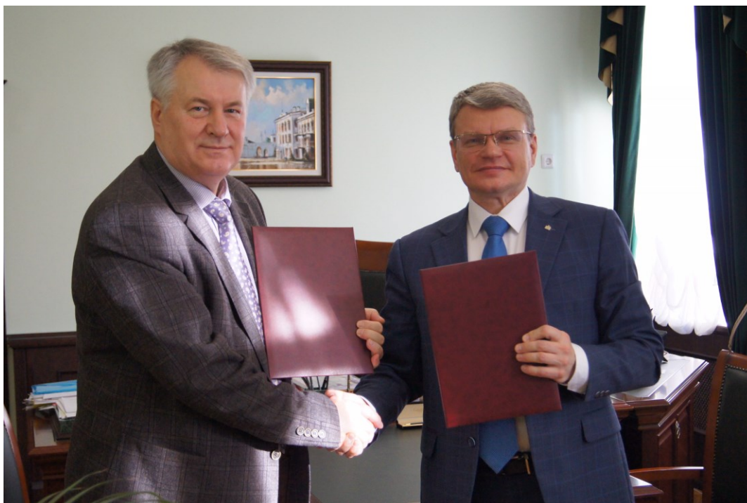
Подписан договор о сотрудничестве с Казанским государственным медицинским университетом (2018)