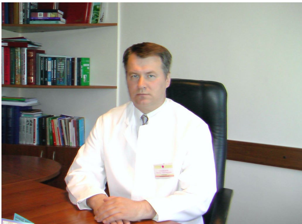
Главный врач Гродненского областного кардиологического диспансера (2001)