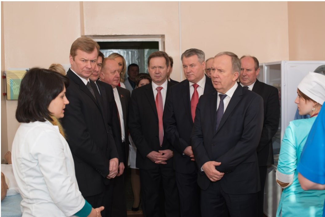
Посещение симуляционного центра ГрГМУ министром здравоохранения В. И. Жарко (2014)