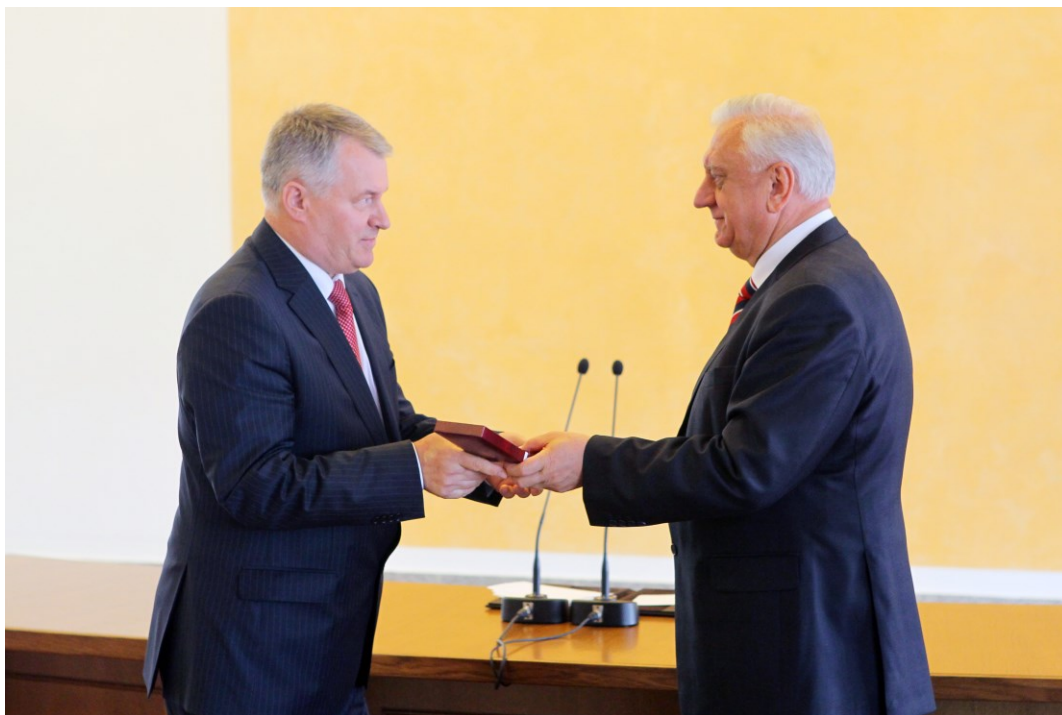
Вручение Премьер-министром М. В. Мясниковичем медали Ф. Скорины ректору (июль 2014)