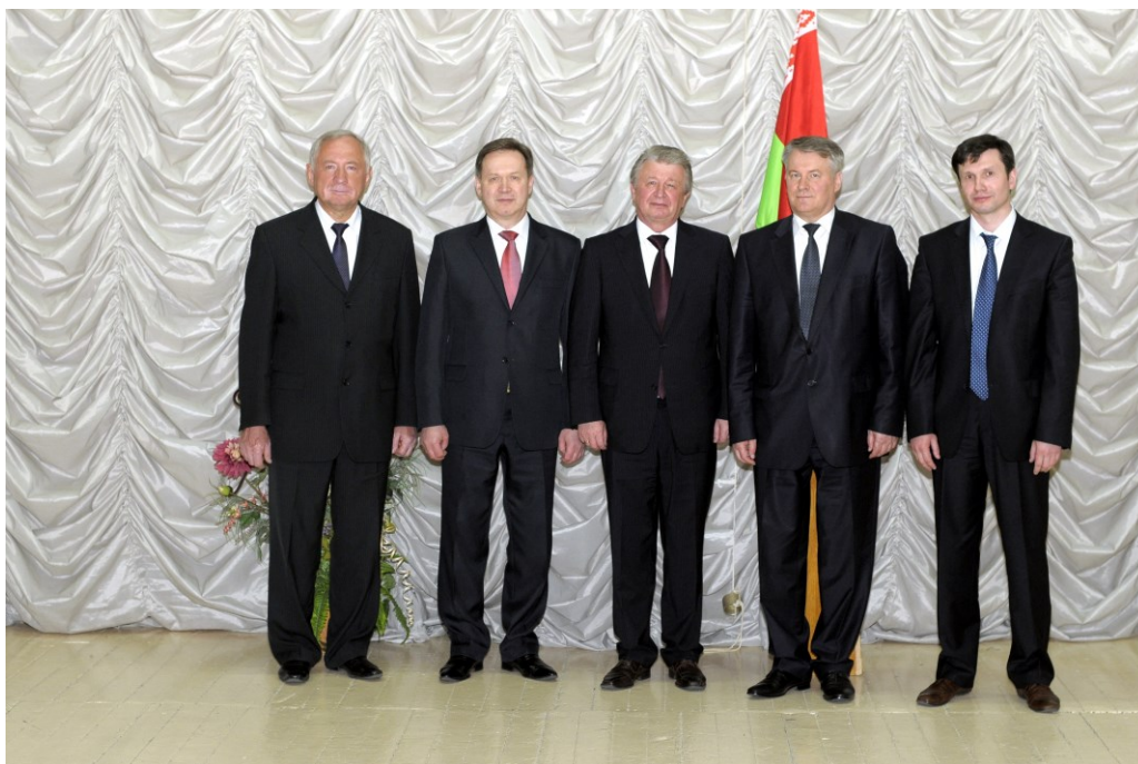
Визит первого заместителя главы Администрации Президента Республики Беларусь А. М. Радькова в ГрГМУ (2013)