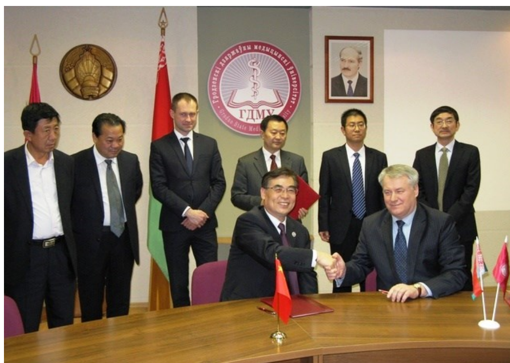
Визит иностранной делегации из провинции Ганьсу Китайской Народной Республики в ГрГМУ (2016)