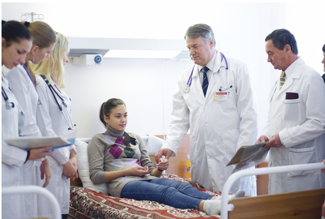
Во время обхода (Гродненский областной клинический кардиологический центр, 2014)