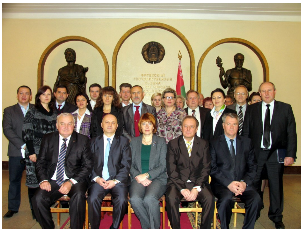
На заседании УМО Министерства здравоохранения Республики Беларусь (Витебск, 2013)