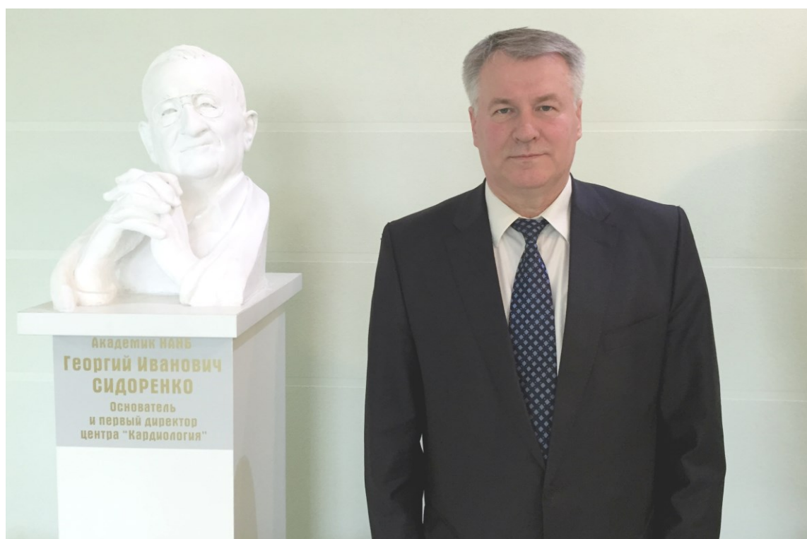
В день открытия бюста академику Г. И. Сидоренко (Минск, РНПЦ Кардиология – 2016)