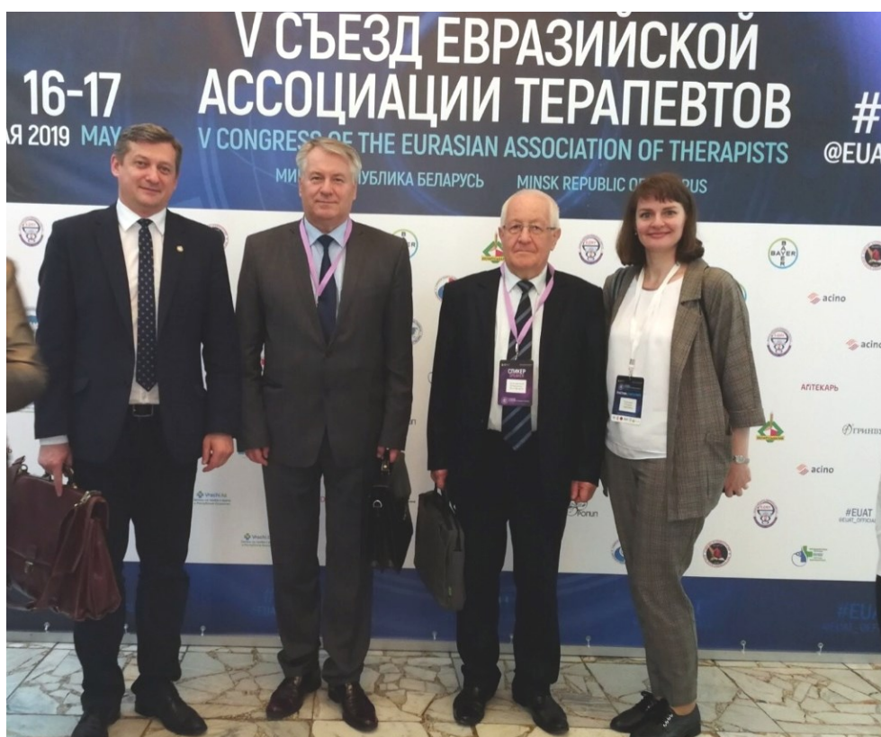
5-й съезд Евразийской ассоциации терапевтов (Минск, 2019)