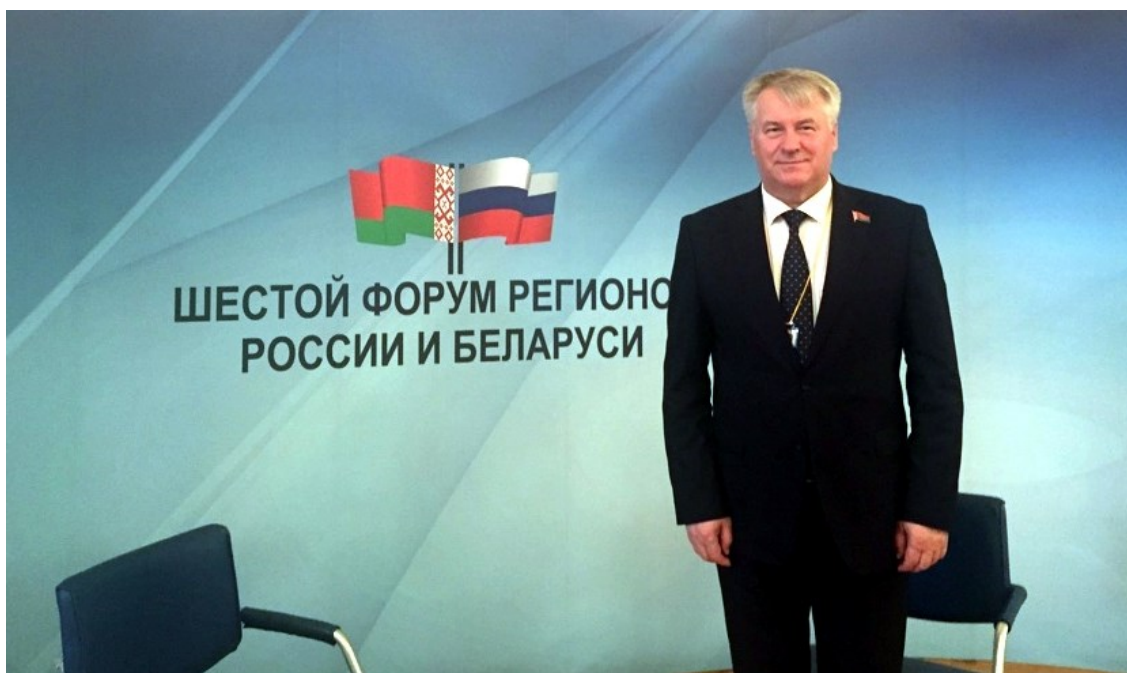
6-й Форум регионов Республики Беларусь и РФ (Санкт-Петербург, 2019)