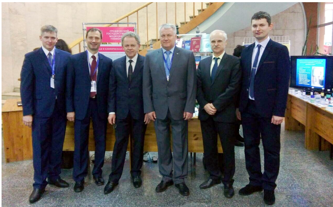
У стенда ГрГМУ на 2-м съезде ученых Республики Беларусь (2018)