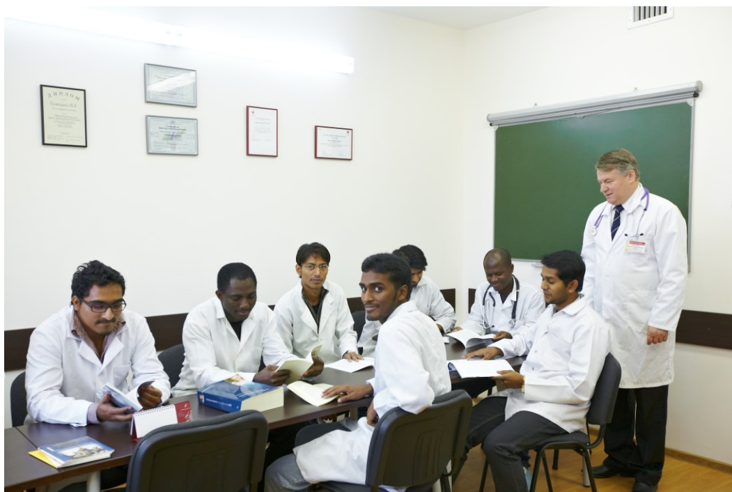
На занятиях с иностранными студентами (Гродненский областной клинический кардиологический центр, 2014)