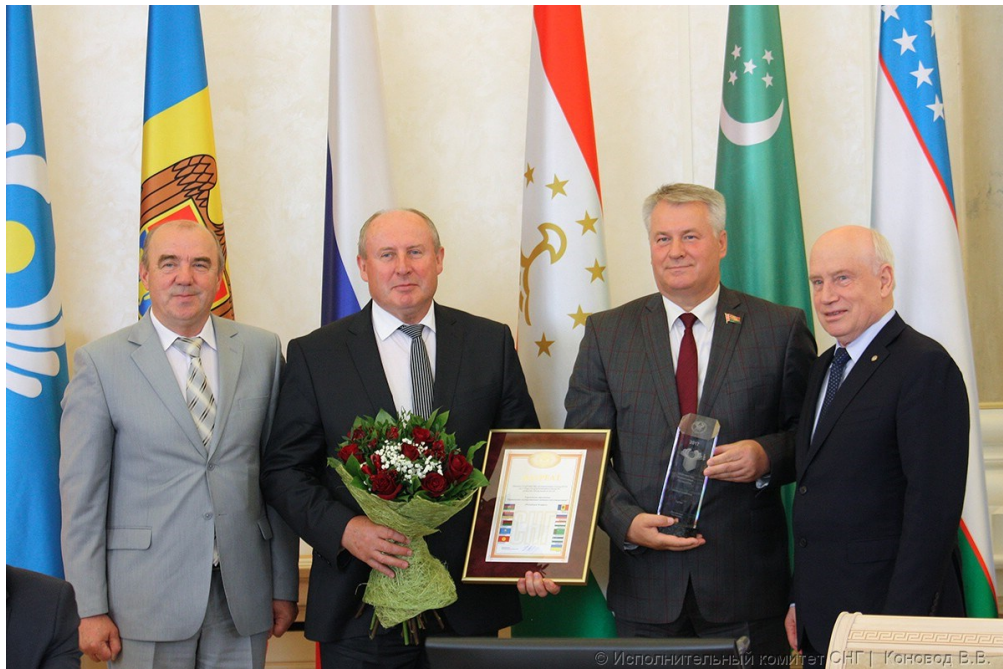
Церемония награждения победителей конкурса на соискание Премии Содружества Независимых Государств 2017 года