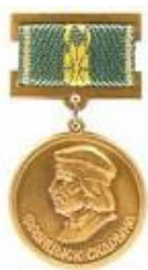
Медаль Франциска Скорины (2014)