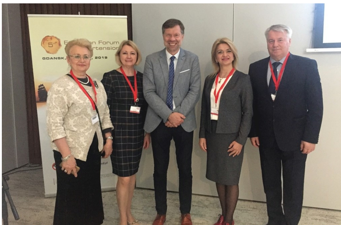
Форум по артериальной гипертензии в Гданьске (Польша, 2019)