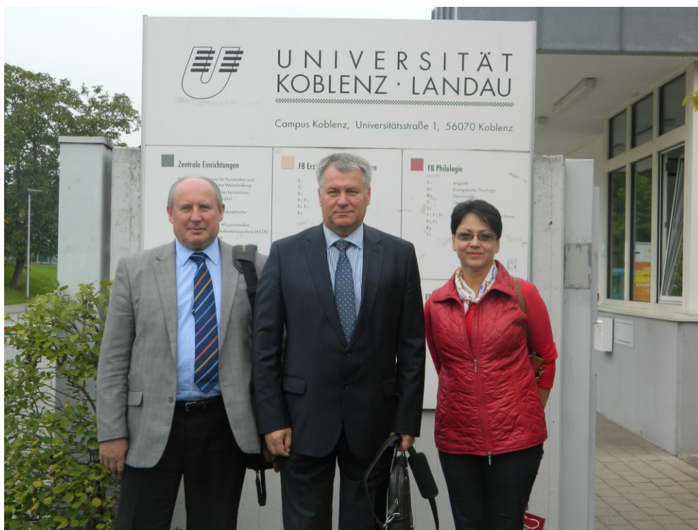
Реализация проекта Темпус в университете Кобленц-Ландау (Германия, 2014)