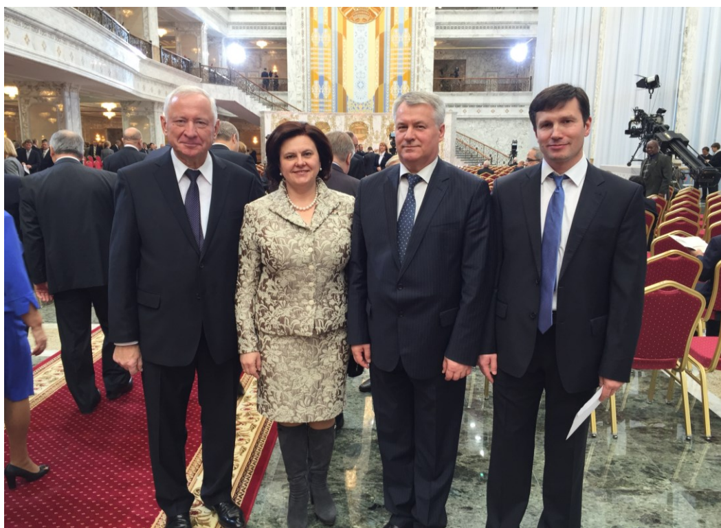
На інаўгурацыі Прэзідэнта Рэспублікі Беларусь (2015)