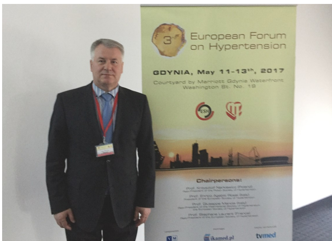
Доклад на Европейском форуме по артериальной гипертензии в Гдыне (Польша, 2017)