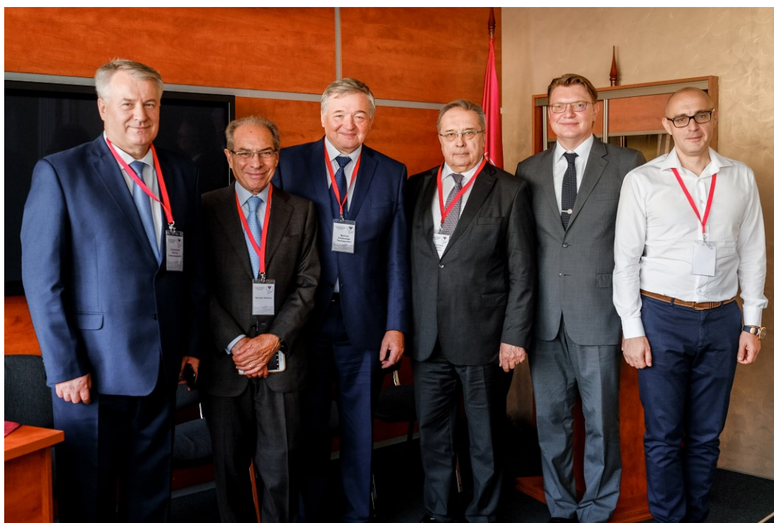
I-й съезд Евразийской аритмологической ассоциации проходит в ГрГМУ (2018)