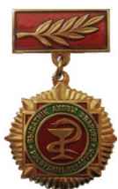
Медаль Федерации профсоюзов Беларуси «100 лет профсоюзному движению Беларуси» (2013)

Юбилейная медаль «100 лет Вооруженным Силам Республики Беларусь» (2018)