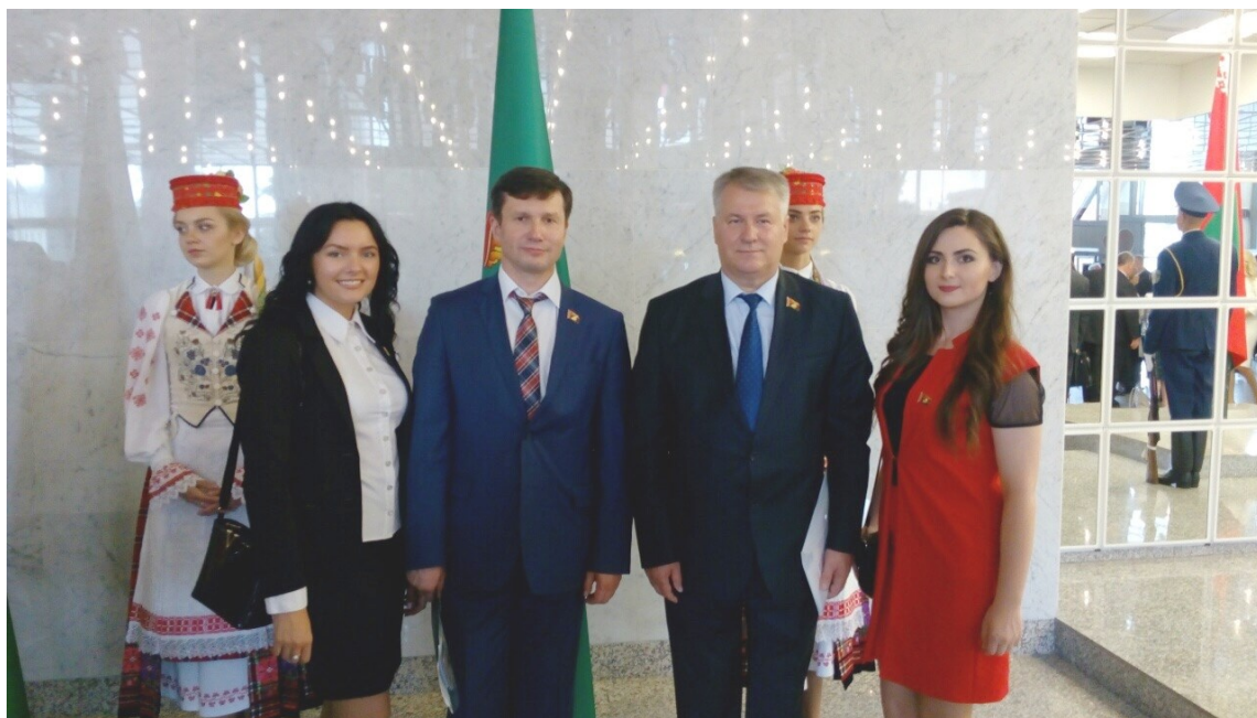
На 5-м Всебелорусском собрании (2016)