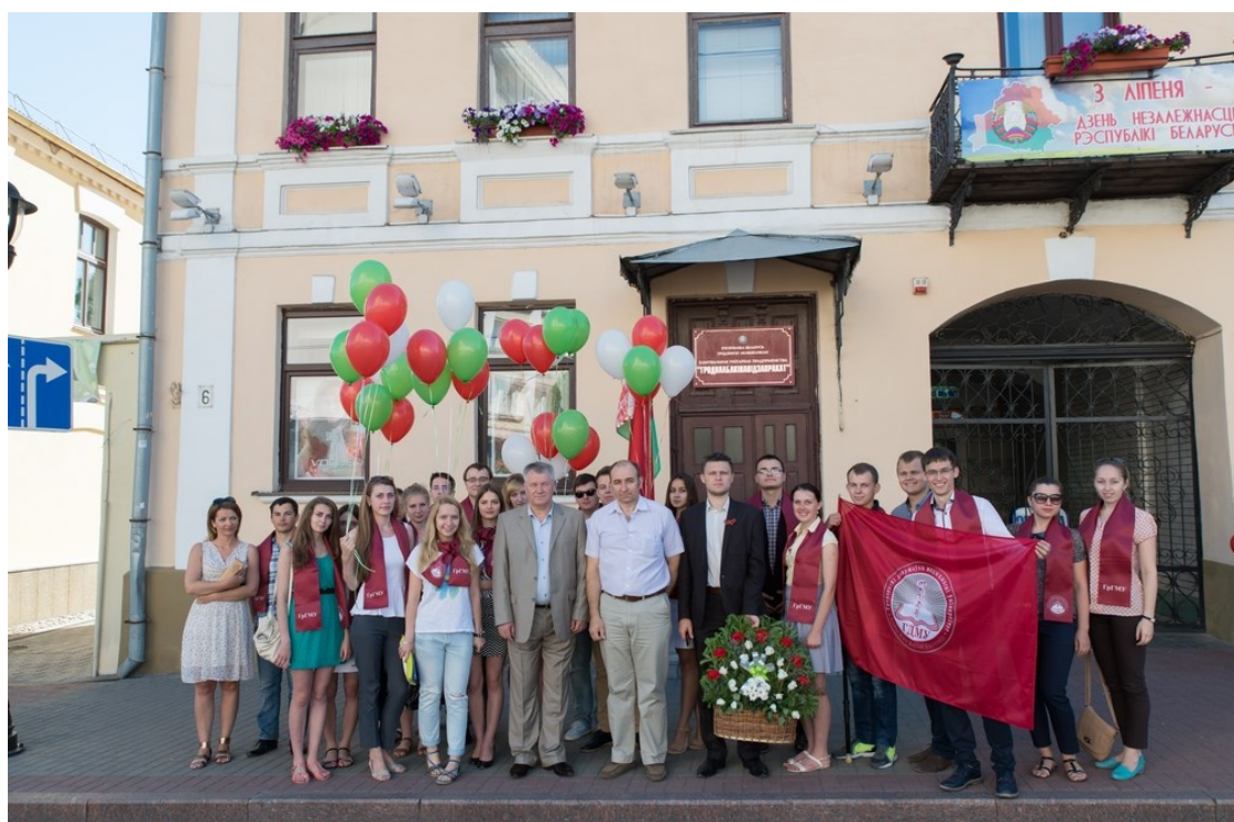
На праздновании дня Независимости Республики Беларусь (2015)