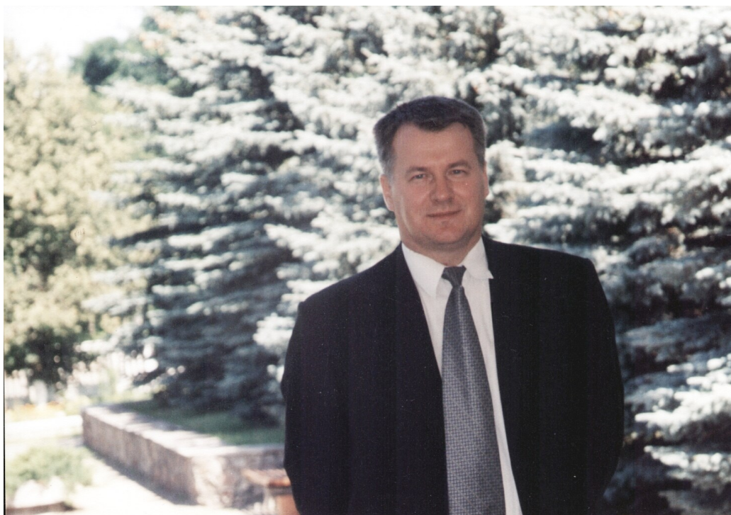
Главный врач Гродненского областного кардиологического диспансера (2002)