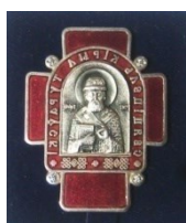
Медаль Белорусской Православной Церкви «Святитель Кирилл Туровский» (2011)