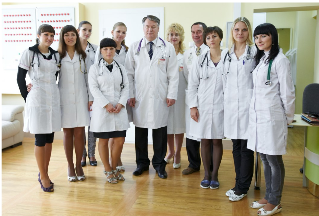
После обхода в отделении Гродненского областного клинического кардиологического центра со студентами 6 курса (2014)