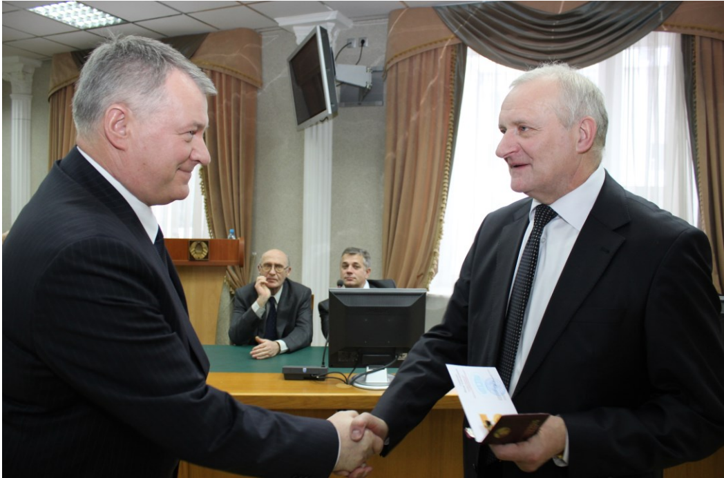
Вручение удостоверения член-корреспондента председателем Президиума Национальной академии наук Беларуси В. Г. Гусаковым (2014)