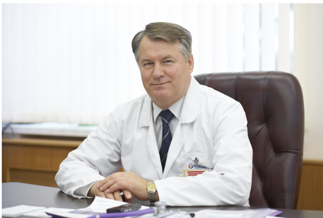
В клинике кардиологии (2014)