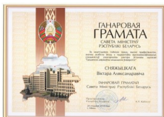
Почетная грамота Совета Министров Республики Беларусь (2018)

Почётная награда международного Красного Креста «Гуманное сердце» (2016)