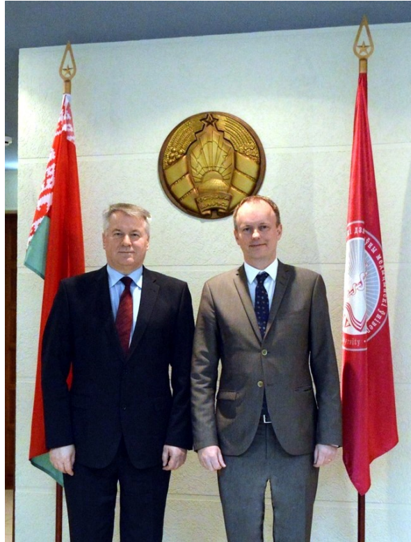
Визит Чрезвычайного и Полномочного Посла Королевства Швеция в Республике Беларусь господина Мартина Оберга в ГрГМУ (2016)