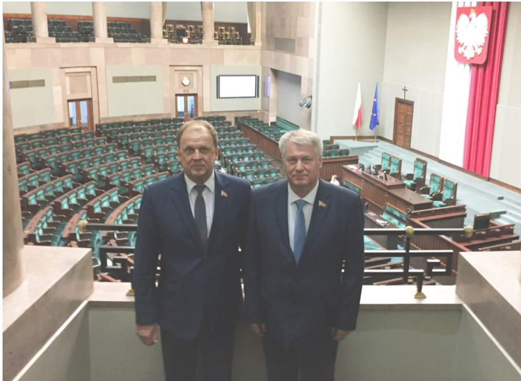
Официальный визит в парламент Республики Польша (2018)