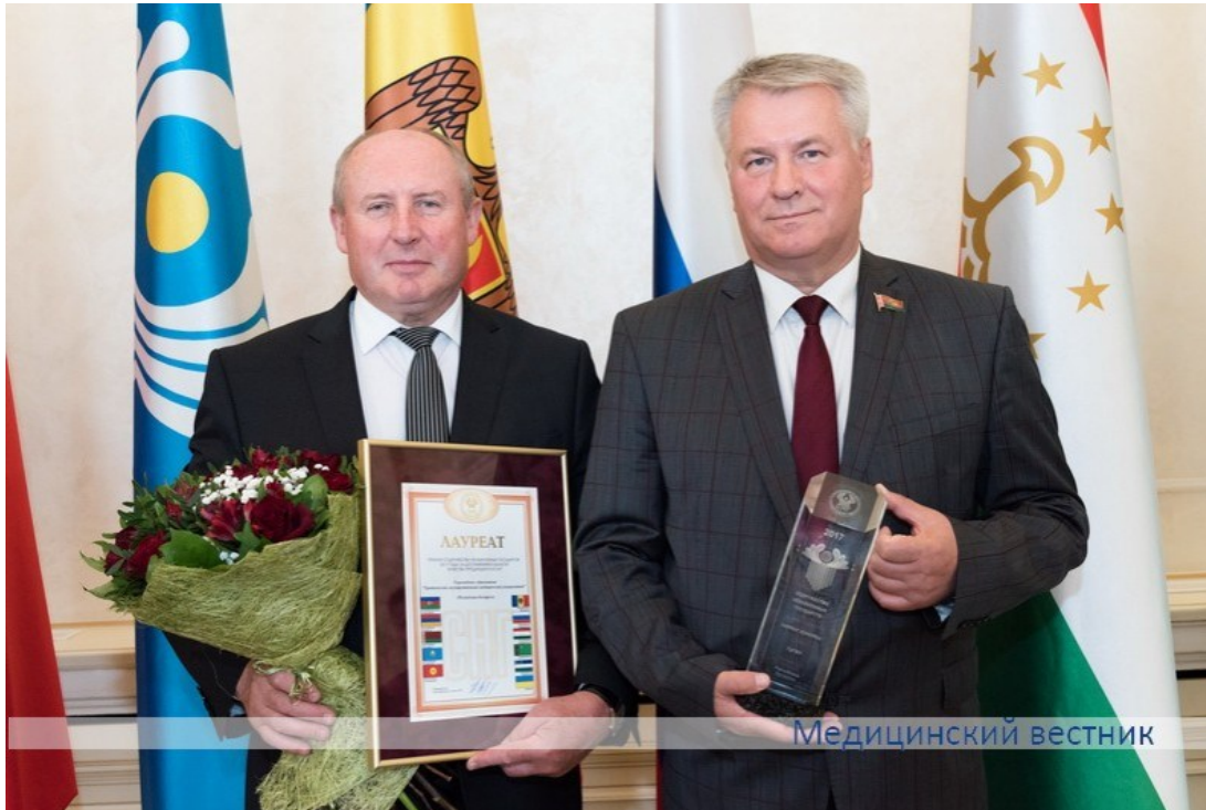
Вручение ГрГМУ Премии СНГ в области качества (2018)