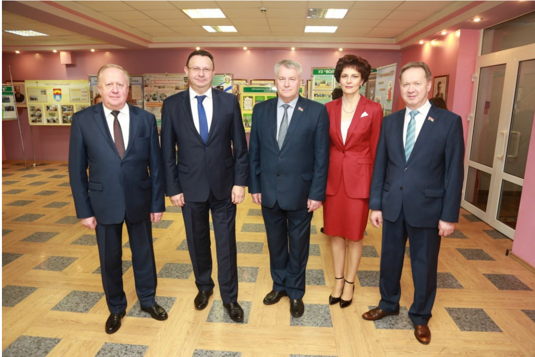
Итоговое заседание коллегии Главного управления здравоохранения Гродненской области (2019)