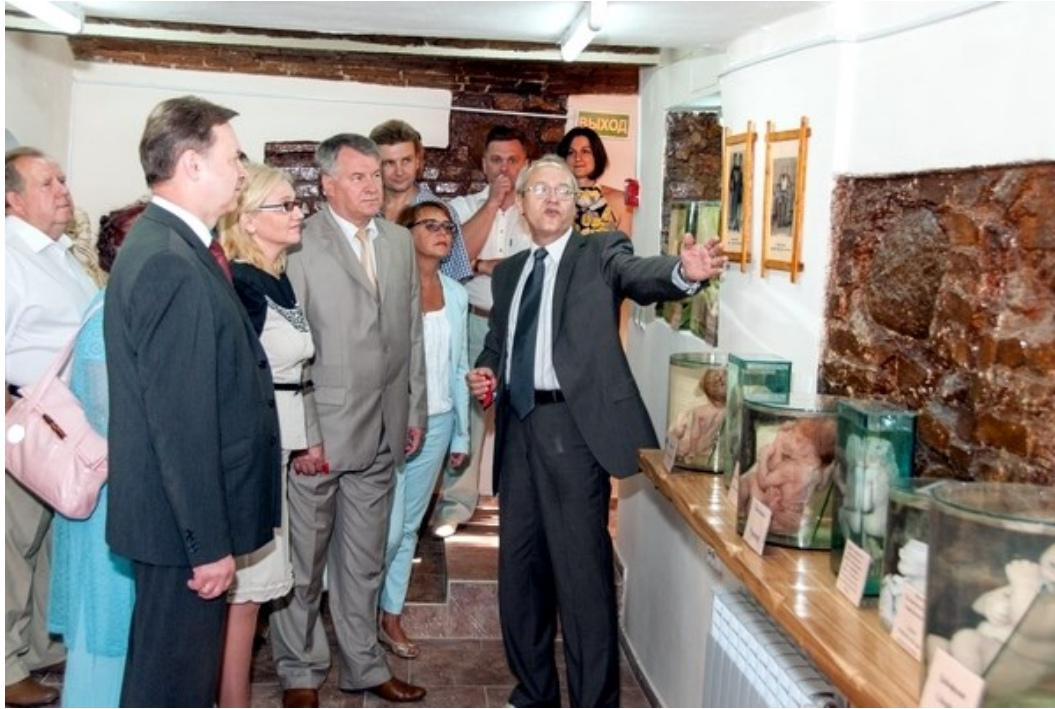
Торжественное открытие анатомической экспозиции ГрГМУ (2013)