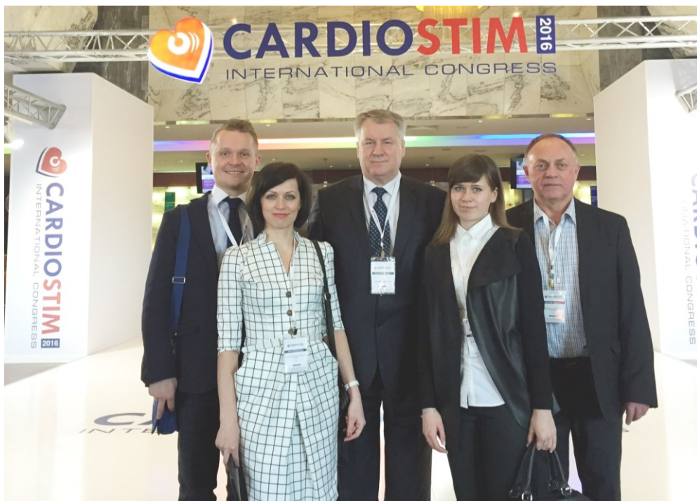
На конгрессе Кардиостим в Санкт-Петербурге (2016)