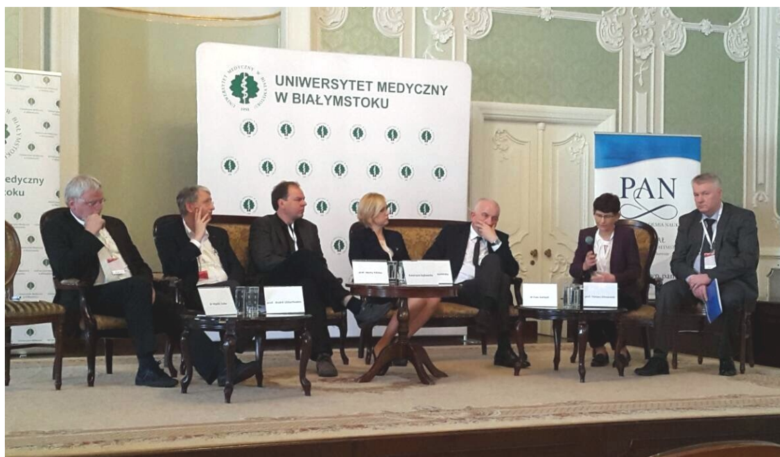
Панельная дискуссия на конференции в Белостоке (Польша, 2018)