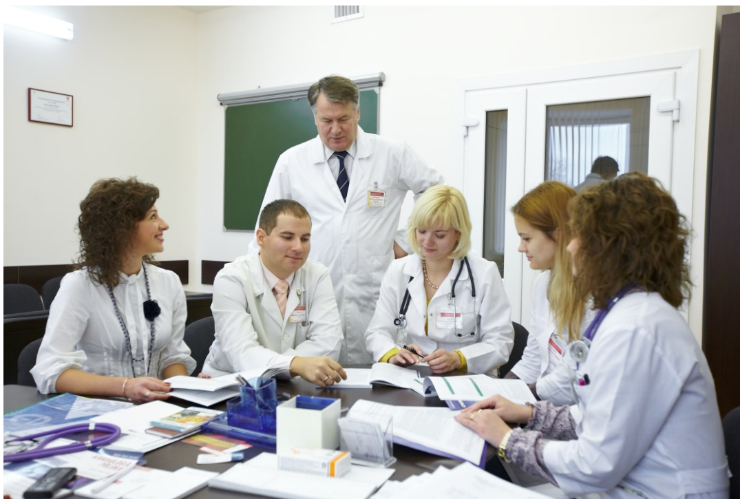
На занятиях с аспирантами (Гродненский областной клинический кардиологический центр, 2014)