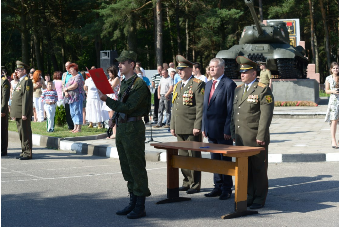
Студенты ГрГМУ принимают военную присягу (2014)