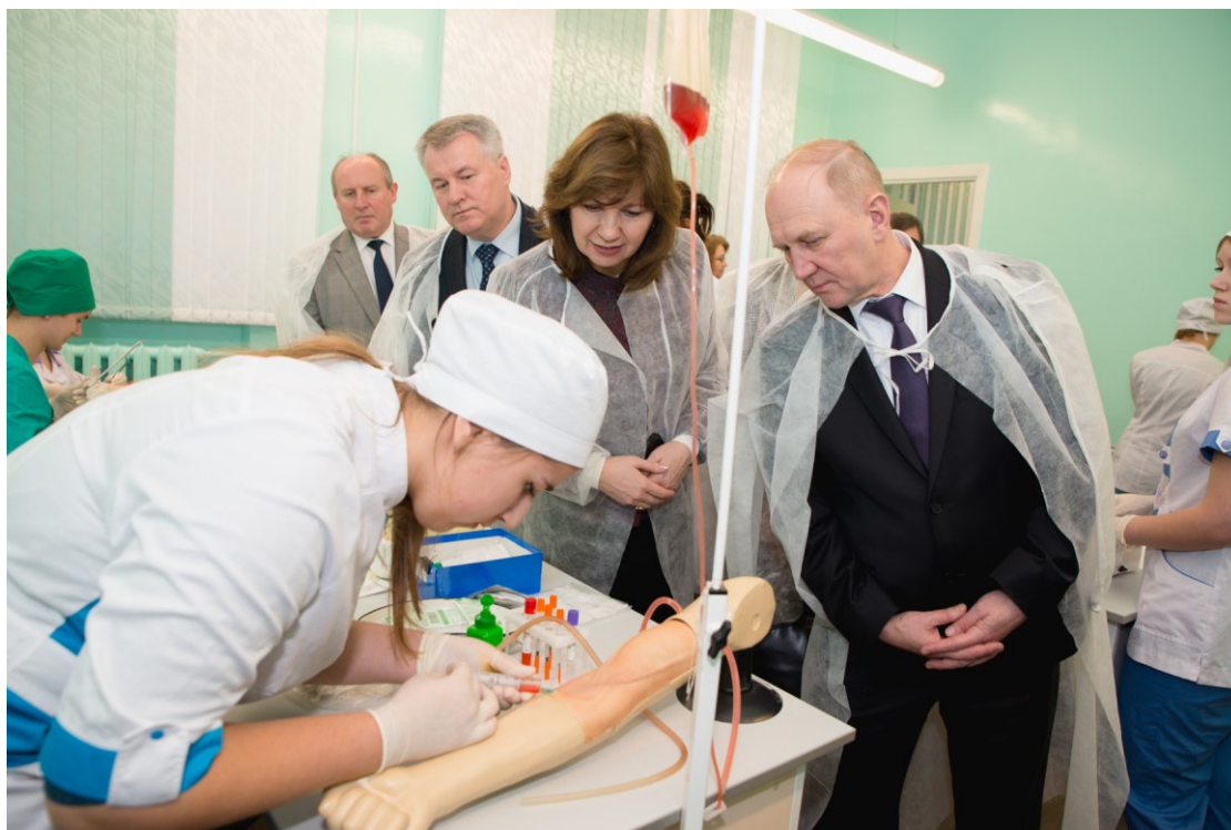
Симуляционный центр ГрГМУ посетила заместитель Премьер-министра Республики Беларусь Н. И. Качанова (2015)