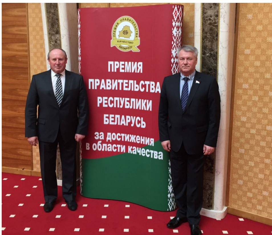
На вручении ГрГМУ Премии правительства Республики Беларусь (2017)