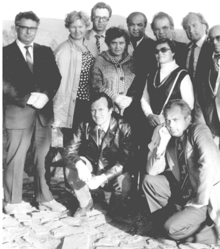
Участники Всесоюзной конференции по витаминам в г. Иркутске (1984)