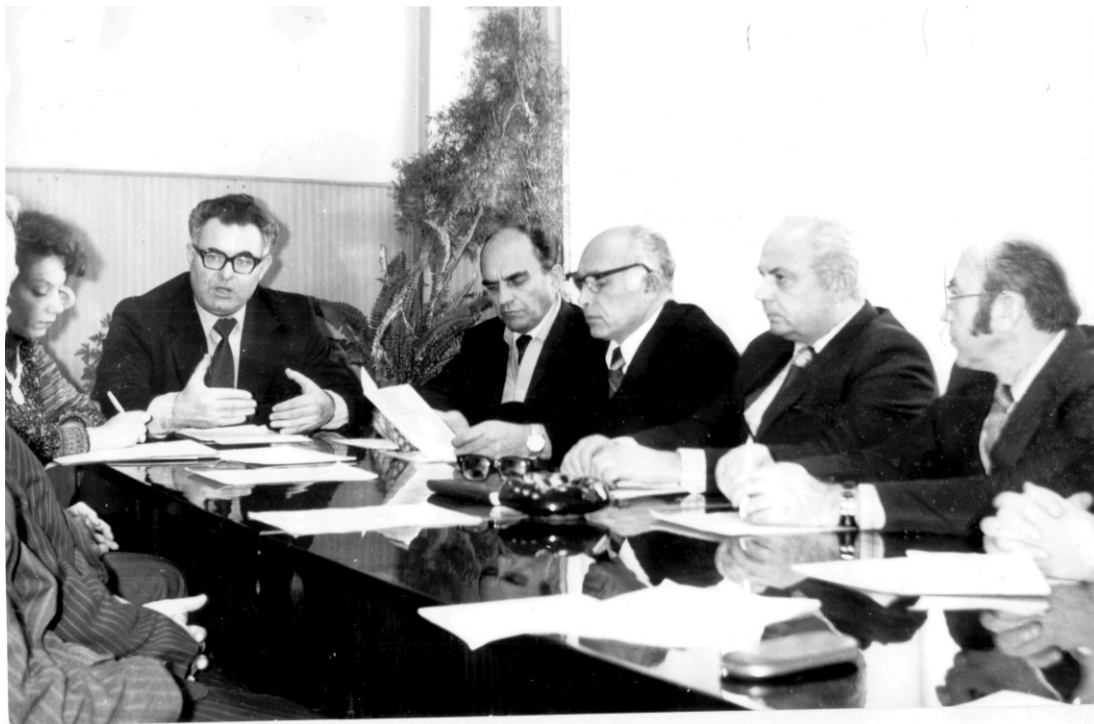
Заседание Центрального методического совета ГрГМИ (1980)