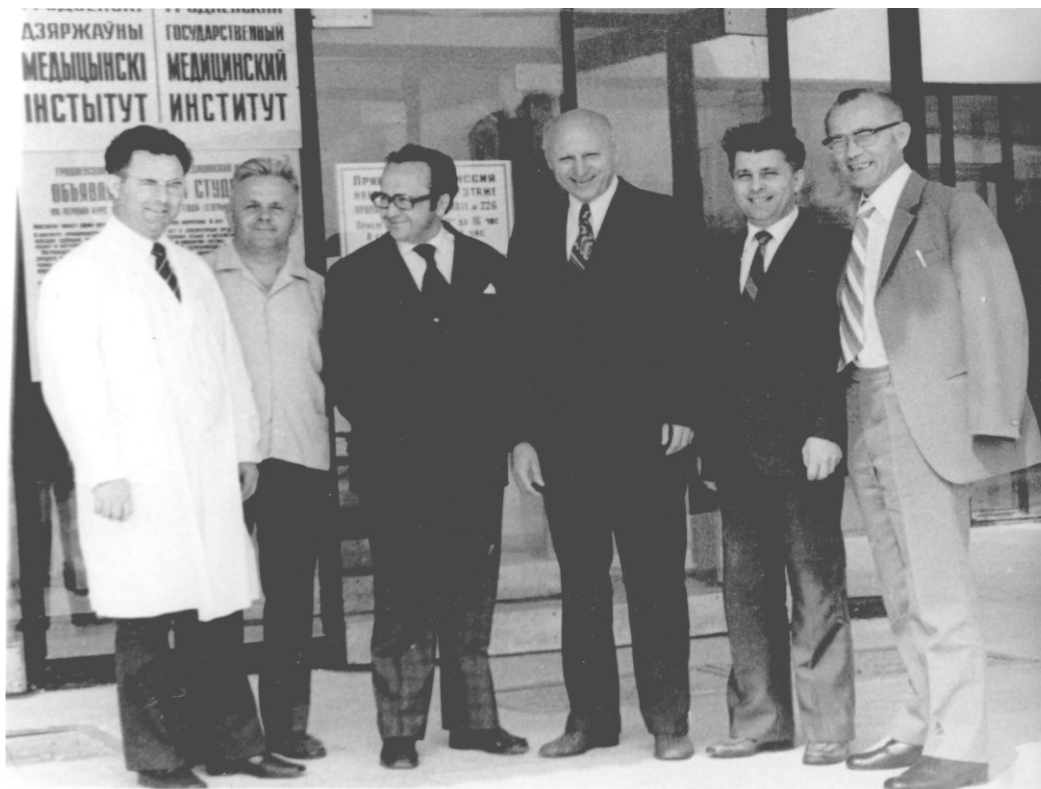
Руководители ГГМИ и Белостокской медицинской академии