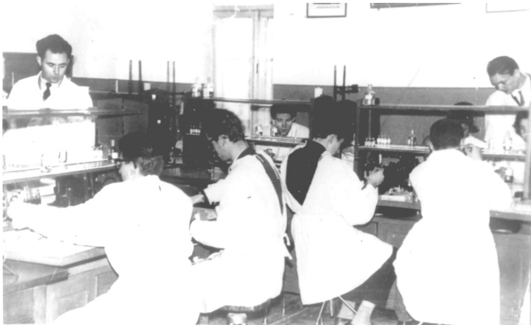
Лабораторные занятия по биохимии (1961)