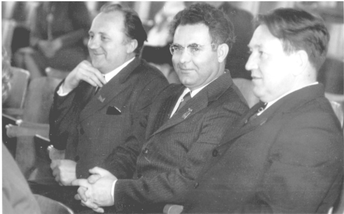
20-летие выпуска врачей ВГМУ (1979)