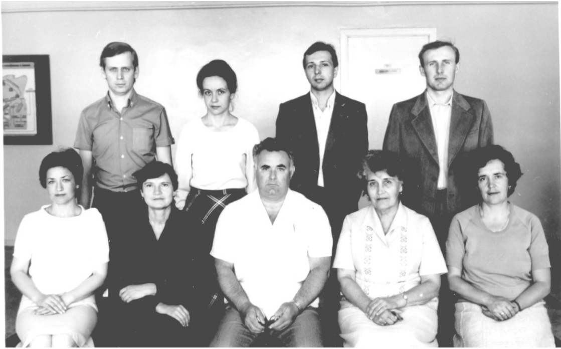
Коллектив кафедры биохимии (1982)