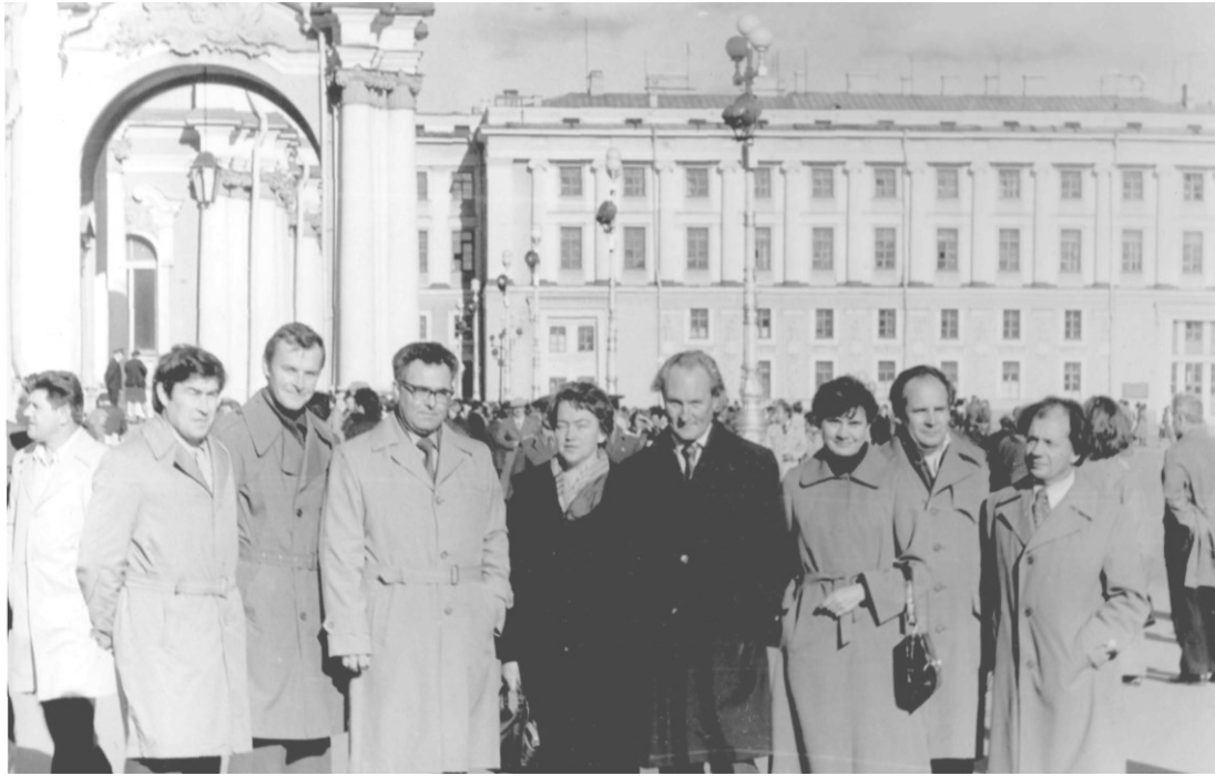
Биохимики Гродно на Всесоюзном съезде в Ленинграде (1980)