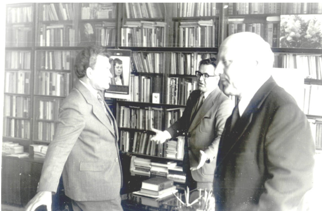
Министр Здравоохранения БССР Н. Е. Савченко на кафедре биохимии (1984).