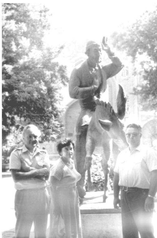
Участники Всесоюзного совещания по витаминологии в Самарканде (1986)