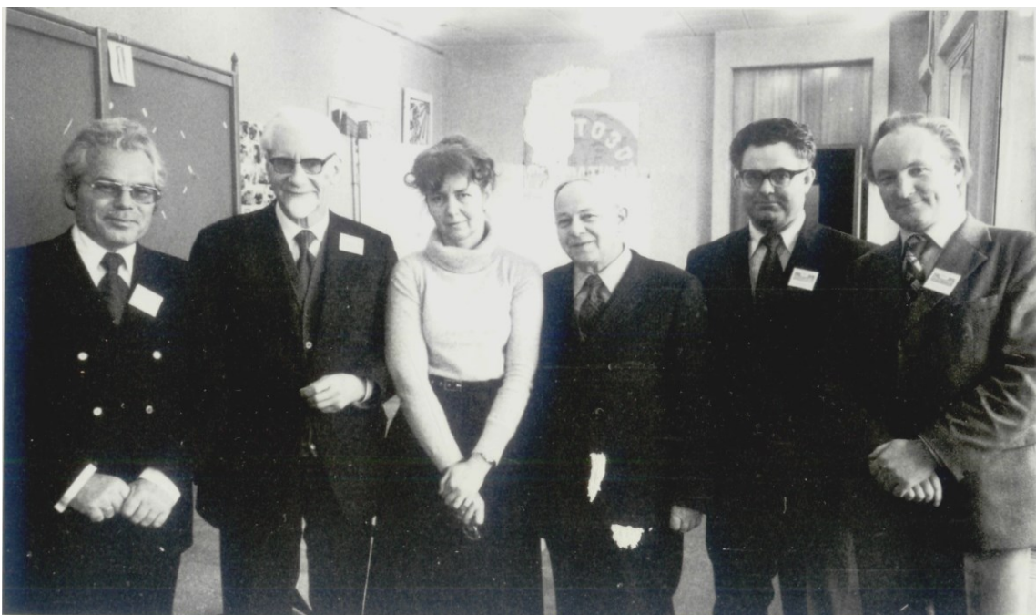
С ведущими биохимиками СССР (1978)