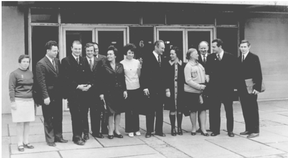
Белорусские биохимики на Всесоюзном съезде в г. Риге