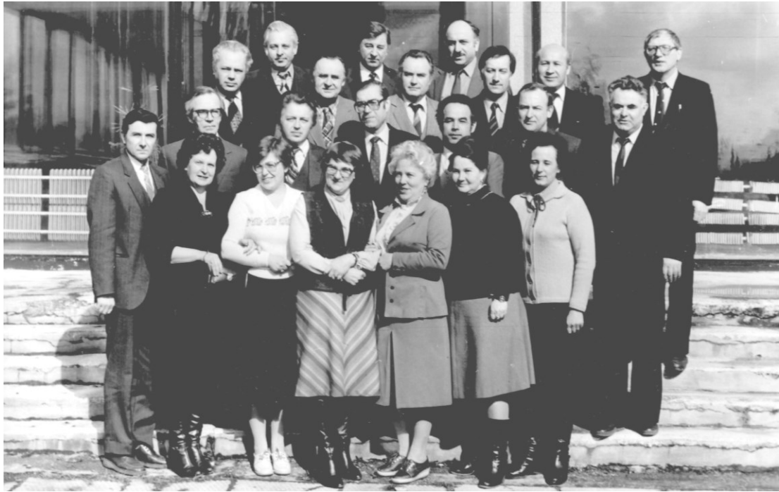
Участники Центральной научно-методической комиссии по преподаванию химических дисциплин в медВУЗах СССР (1982)