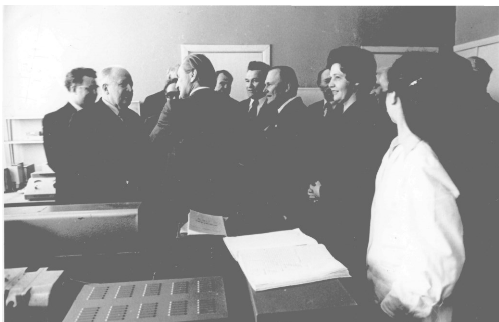
Посещение кафедры биохимии руководством Минздрава, республики и области (1982)