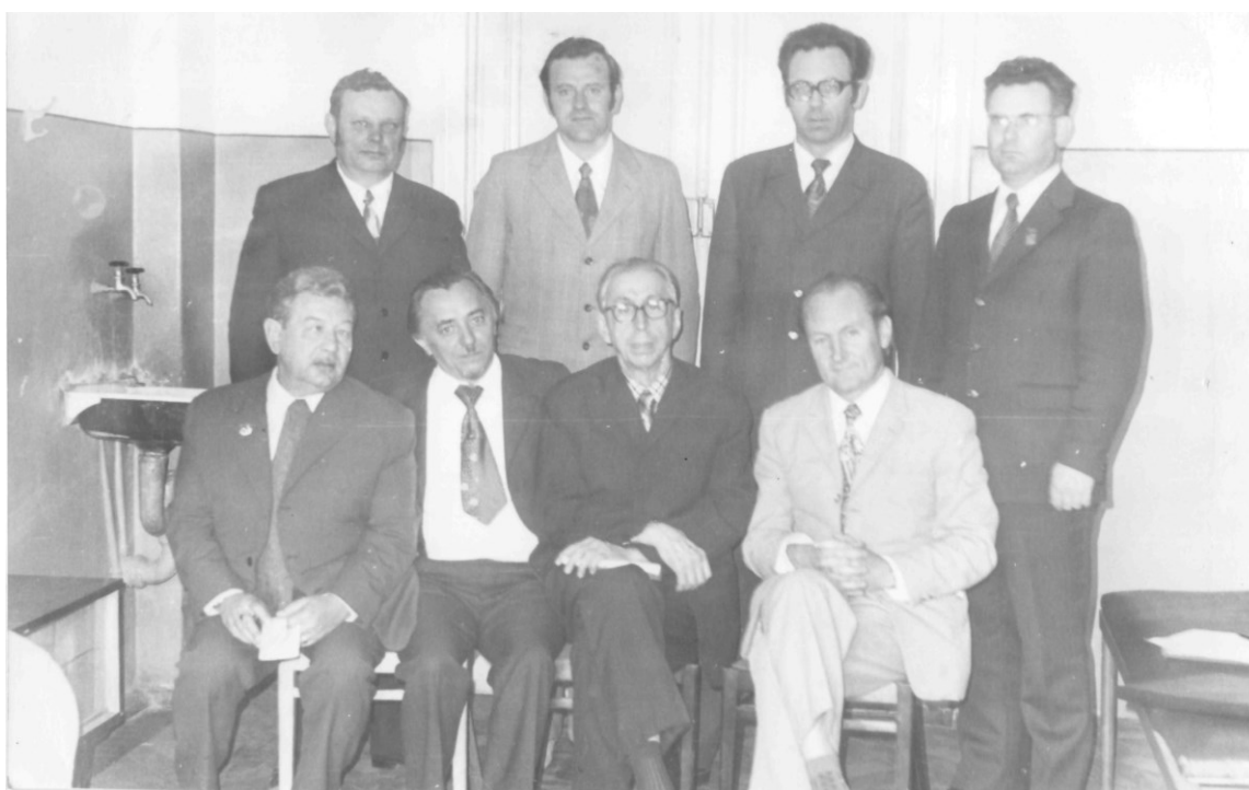
Руководители симпозиума по межвитаминам отношениям (1975)