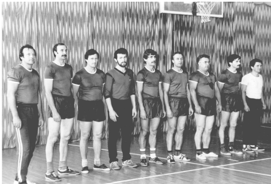
Волейбольная команда «Импульс» (1987)