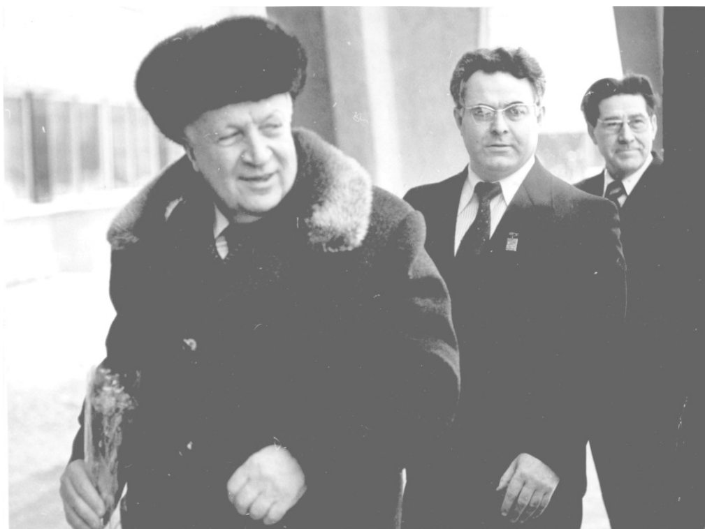
Встреча министра Здравоохранения СССР Б. В. Петровского в ГрГМИ (1982)