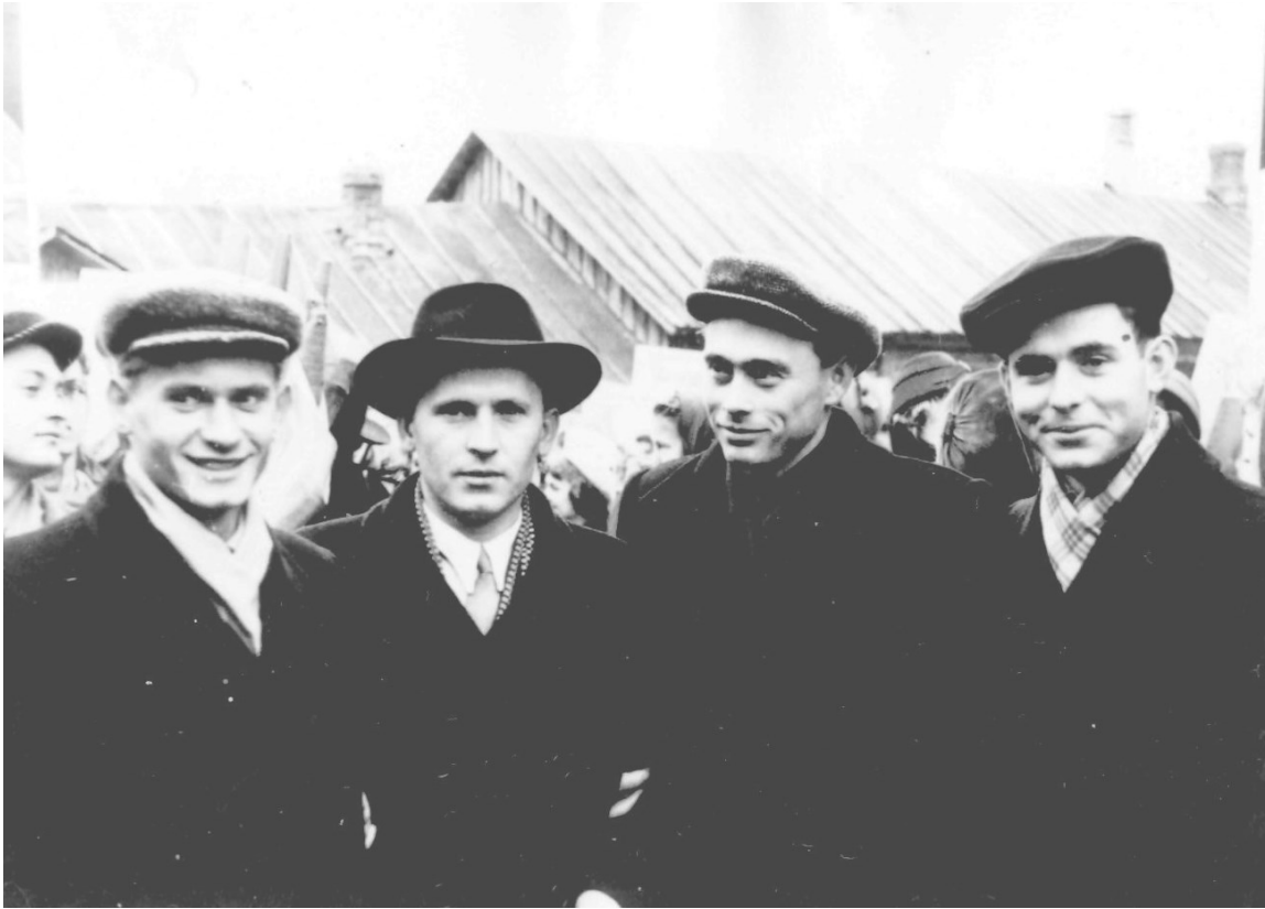
Студенты 6-го курса ВГМИ (1959)