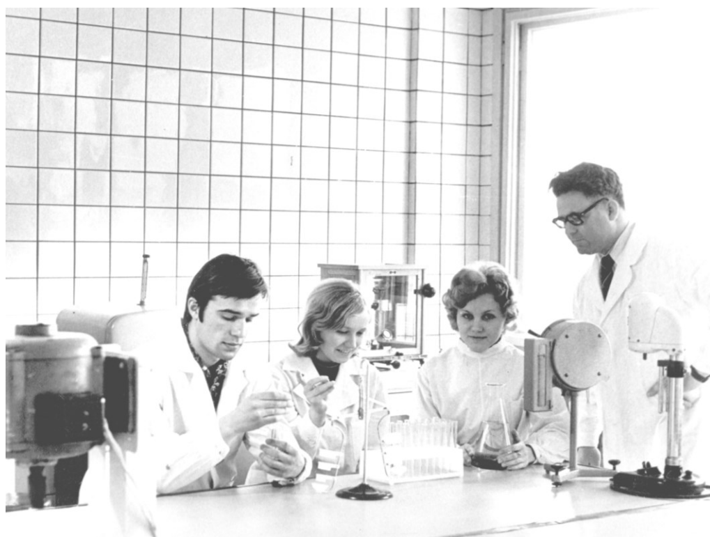
С активом студенческого научного кружка (1969)